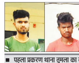
पहला प्रकरण थाना तुमला का तो दूसरा थाना नारायणपुर का

पुलिस से मिली जानकारी के अनुसार पहले प्रकरण का विवरण इस प्रकार है कि थाना फरसाबहार क्षेत्र का एक पिता ने 30 अप्रैल 22 को थाना तुमला में रिपोर्ट दर्ज कराया कि उसकी 15 वर्षीय नाबालिग पुत्री अपने नाना-नानी के घर (थाना तुमला क्षेत्र स्थित एक ग्राम) में गई थी, 28 अप्रैल 22 की रात्रि 08 बजे