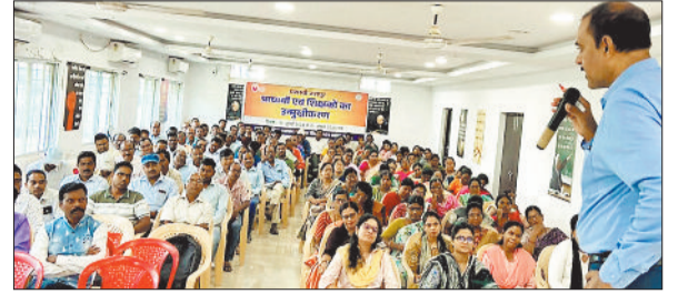
प्राचार्य व शिक्षकों का उन्मुखीकरण कार्यशाला।